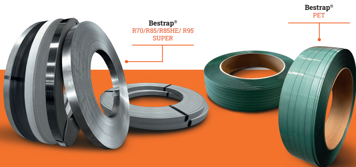
Bestrap® R70/R85/R85HE/ R95 SUPER

Stazione di reggiatura completa dotata di un sistema di sollevamento a batteria innovativo e brevettato, per trasformare un'operazione faticosa in un gesto semplice e controllato.